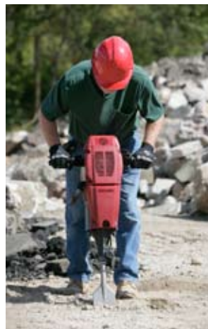
Săparea pământului dur și înghețat.