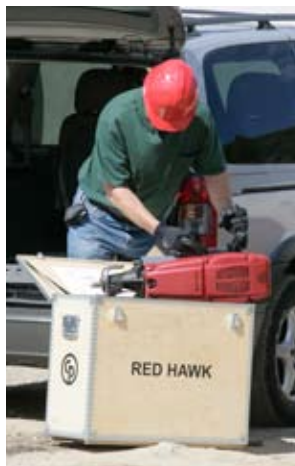
Ușor de transportat în cutia comodă de lemn.

Nu există limite de utilizare pentru acest demolator versatil! Cu o energie de impact de 24 J, frecvența loviturilor 2.600 lov/min, și o gamă largă de unelte de lucru, face ușor abordabile lucrările cele mai dificile.