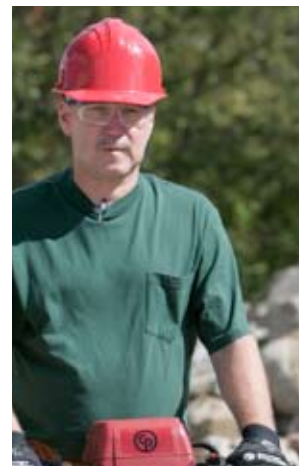
Cu mânerle amortizoare de vibrații simțite diferența.