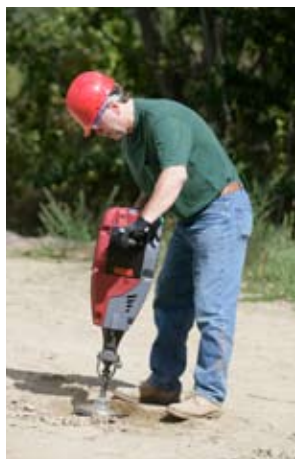
Bătătorirea și compactarea solului.